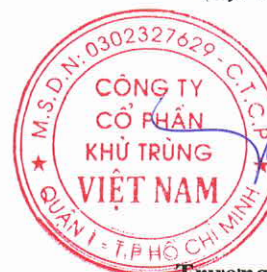
Trương Công Cự